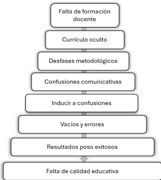
Gráfico N°1 Consecuencias de la falta de formación docente

Los docentes del área de inglés en la escuela primaria, en su mayoría, no cuenta con la formación adecuada para orientar esta área, lo que les obliga a desarrollar procesos que, aunque bien intencionados, no siempre coincide el ideal con la práctica pedagógica en la que, por el bajo dominio de la lengua se presentan desfases metodológicos, los cuales generan vacíos conceptuales, confusiones y errores lingüísticos que dan como resultado una educación con pocos logros exitosos y por ende de baja calidad. Todo esto se encuentra intrínsecamente relacionado con el factor metodológico empleado por los docentes en el aula.