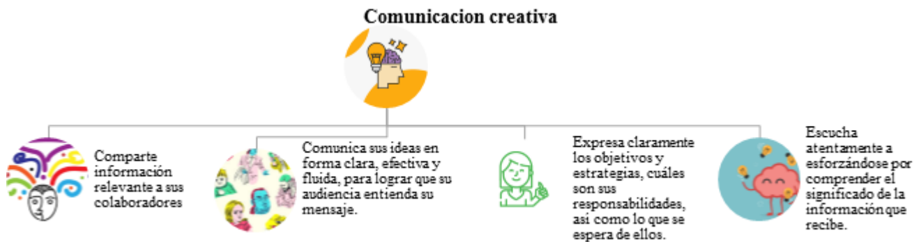
Figura 2 Comunicación creativa.

niños en condición de discapacidad en ocasiones les cuesta efectuar con claridad este acto, ocasionando un alto nivel de frustración en ellos. Es por esto que, las organizaciones en general no pueden existir sin comunicación, pues ésta viabiliza la realización de los procesos y actividades. De acuerdo con lo anterior, los gerentes educativos deben realizar una efectiva comunicación, que integre su equipo para conseguir una caritativa relación interpersonal, así como lograr un excelente vínculo entre docentes y educandos, por lo cual se describen en el grafico aspectos a considerar en el momento de efectuar una conversación entre pares que permita una interacción positiva.