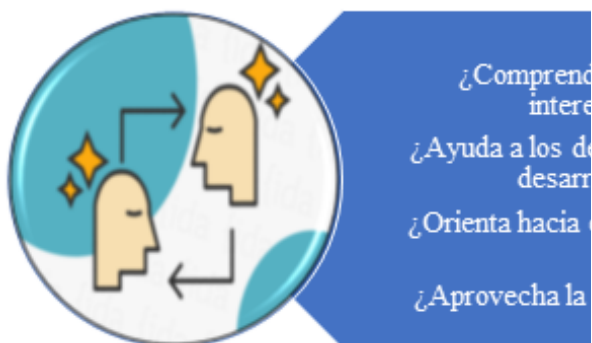
Figura 1. Empatía.

lo que sienten los demás, ser capaces de ver las cosas desde su perspectiva, pretendiendo cultivar la afinidad, empatía, capacidad de entender lo que siente la otra persona, y más a nivel docente puesto que implica descubrir las intranquilidades del otro y responder a ellas, es decir, distinguir los problemas y utilidades profundas bajo los sentimientos, emociones, y necesidades de los demás. Así pues, el docente tiene la tarea de escuchar a sus estudiantes, observar su comportamiento, estilos de aprendizaje, motivación, para así poder entender las problemáticas de los niños y convertirla en una oportunidad de superación y sacarles ventaja. Teniendo en cuenta que las acciones que emplee el docente son fundamentales, se realizará una evaluación de salida después se verificará si se presentó un cambio en la percepción y la conducta para tratarlas de acuerdo con sus reacciones emocionales; algunas preguntas para la evaluación de los docentes son: