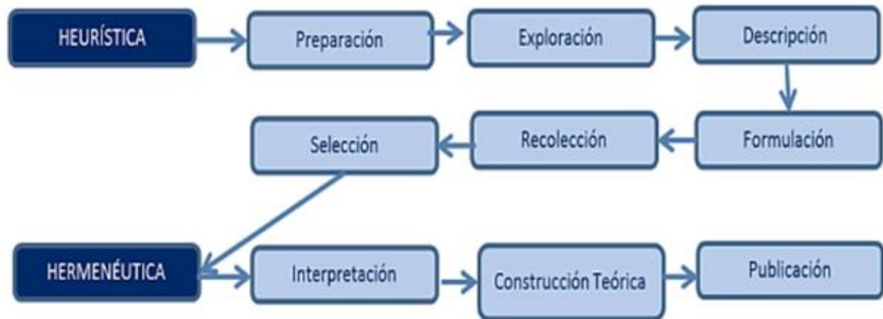
Gráfico 3. Ruta para construir el Estado del Arte. Tomado de: Londoño, Maldonado y Calderón. (2016, p.31).