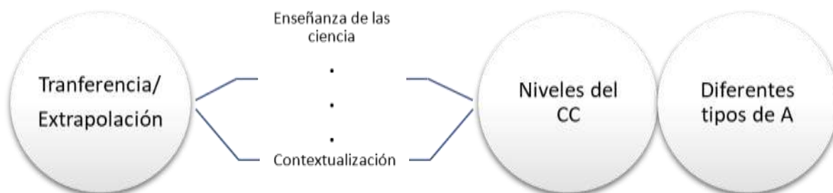
Gráfico 2. Aplicaciones de la enseñanza de las ciencias en contexto. CC: Conocimiento Científico. A: Aprendizaje.

De las informaciones sistematizadas en el cuadro 3, es posible inferir las derivaciones que se exponen en el siguiente gráfico y que se refieren a la enseñanza de las ciencias considerando la contextualización.