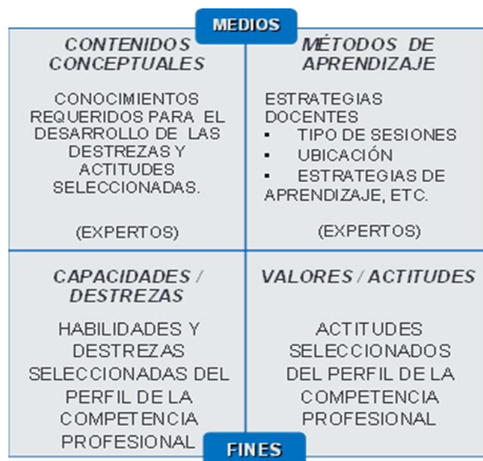
Gráfico 1. Modelo T.

ofrecidas en esta facultad, el cual se basó en el modelo de trabajo o Modelo T (gráfico 1) aportado por el Modelo Socio-Cognitivo (Román y Díez, 1999, 2001), que permite integrar de manera organizada, las habilidades y destrezas, valores y actitudes, como fines o metas del proceso educativo, junto con los contenidos y métodos de aprendizaje, que serían los medios (Patiño, Pérez y Vera, 2013).