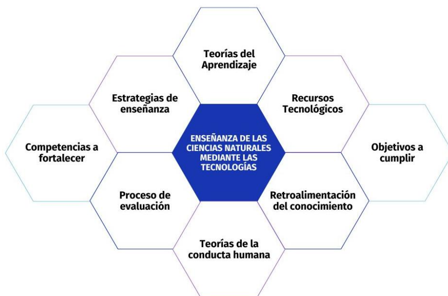
Figura 2. Encuentro de las categorías de análisis.

De hecho, se deja visualizar que al conjugarse las categorías analizadas se establece un acercamiento que conlleva a establecer lo que es la base de los nuevos conocimientos a partir de las categorías previas, tal cual se logran ver en la siguiente figura: