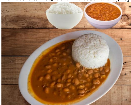
Porción arroz con menestra de frejol

El CORDE localiza su testimonio más antiguo en 1593, Vida y trabajo , obra escrita por el zaragozano Jerónimo de Pasamonte. Pero también se encuentra varias décadas antes: el extremeño Bartolomé de Torres Naharro utilizó el término en Tinellaria , una comedia