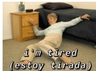
Figura 4. Memes literales 4