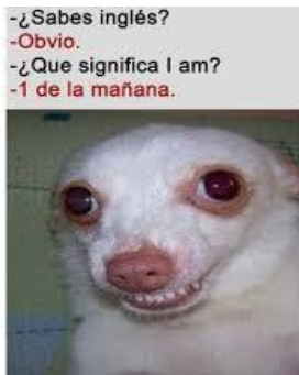
Figura 3. ¿Sabes inglés? 3