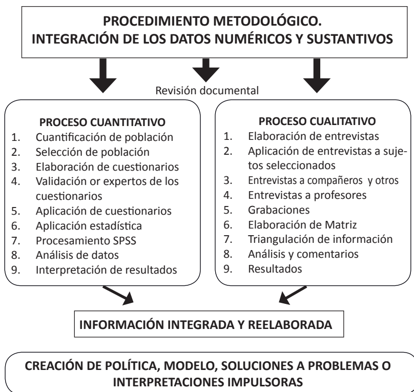
Gráfico 1. Procedimiento metodológico

de las entrevistas. Se desagregaron las matrices por cada grupo y por cada informante y se triangularon buscando información sobre las entrevistadas y, posteriormente, se les dio a leer su propia Historia para su aprobación. La lectura siempre produce un nuevo documento, en el sentido de que cada informante agrega alguna otra situación que considera explicativa o pide que se elimine algunas frases que no quiere hacer pública. Se analizan, aparte, otros factores que pueden servir de insumos a las investigaciones de la cultura estudiada. Al final, se integran y reelaboran los procesos (gráfico 1).