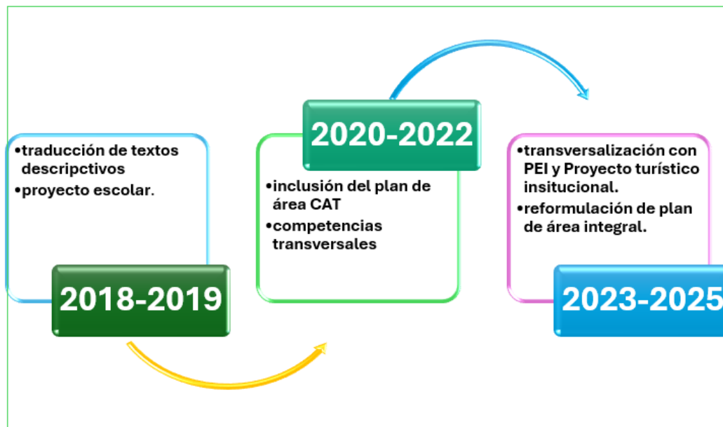
Figura 1: Evolución de la experiencia a través del plan de área de Inglés CAN

Durante el año 2018, cuando se inició con la experiencia pedagógica, su planeación estuvo enmarcada en el Festival de la canción y su propósito inicialmente fue hacer una descripción en inglés de algunos sitios cercanos a la institución que representaran turismo de descanso y rural; se contó con la participación de 9 docentes de inglés del municipio de Saravena-Arauca y los 20 estudiantes de grado undécimo del momento. A partir del análisis del discurso, como instrumento etnográfico analizado por Fairclough, (2023) donde menciona que: “Los discursos pueden, en determinadas condiciones, hacerse operativos, "ponerse en práctica", un proceso dialectal con tres aspectos: pueden promulgarse como nuevas formas de (inter)actuar, pueden inculcarse como nuevas formas de ser (identidades) o pueden materializarse físicamente. (p. 7)”;