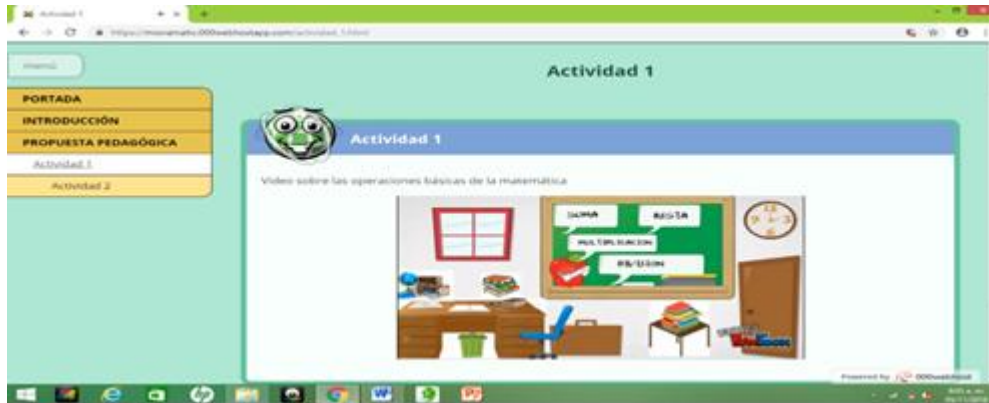
Figura 2. Propuesta de mediación

experiencia de aprendizaje efectiva y motivadora para los estudiantes. Se llevaron a cabo pruebas piloto para detectar posibles ajustes y se validó el contenido con expertos en educación matemática.