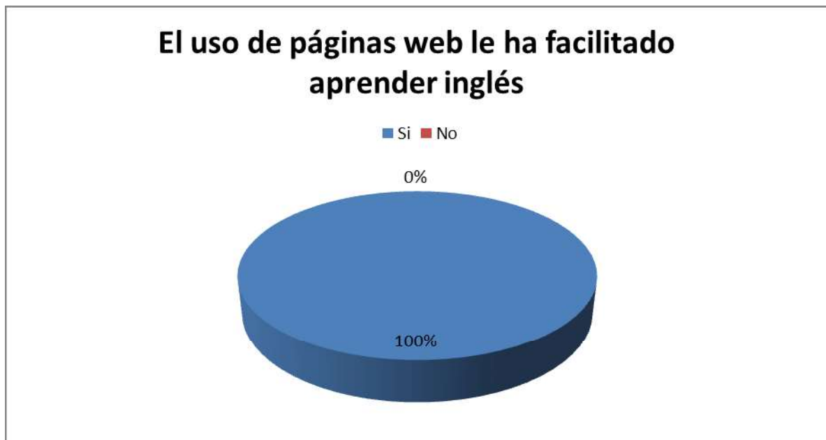
Gráfico N° 2. El uso de páginas web le ha facilitado aprender inglés.

En relación con las páginas web un estudiante comentó “Buenas porque ayudan a entender el inglés más fácil y me parece más divertido que en el salón si porque me gusta el inglés”